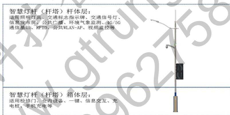
图1 智慧灯杆（多功能杆）杆体分层结构图

5.4.3 箱体设计：箱体应分仓设计，强弱电分开走线。箱体内强电设备应设置在上部舱室，强电设置的高度应参考该区域有记录的历史最高积水高度以及城市道路规划对积水高度的要求，弱电设备应设置在底部舱室，以应对多发的暴雨水浸发生漏电风险，箱体内漏电需有相应的告警及漏电保护。